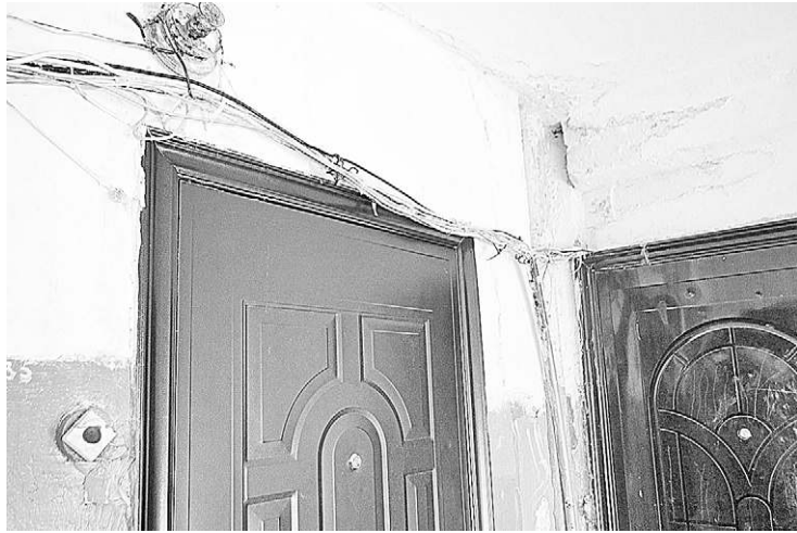
Дверь в квартиру ветерана.