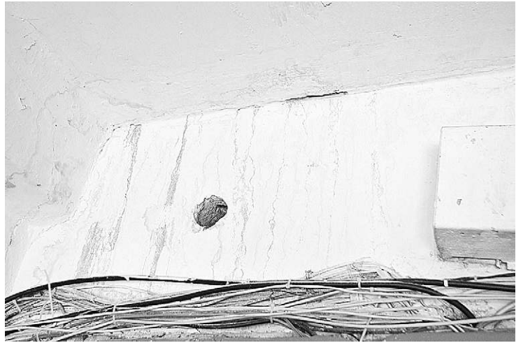
Следы протечек в подвезде.

87 лет, награждена медалью «За доблестный труд в Великой Отечественной войне».