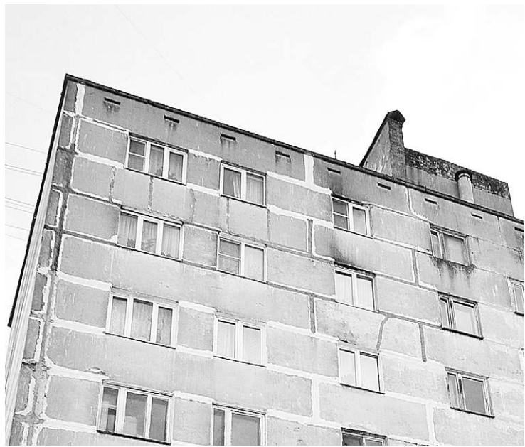
9-этажный дом на улице Королева нуждается в капремонте кровли.