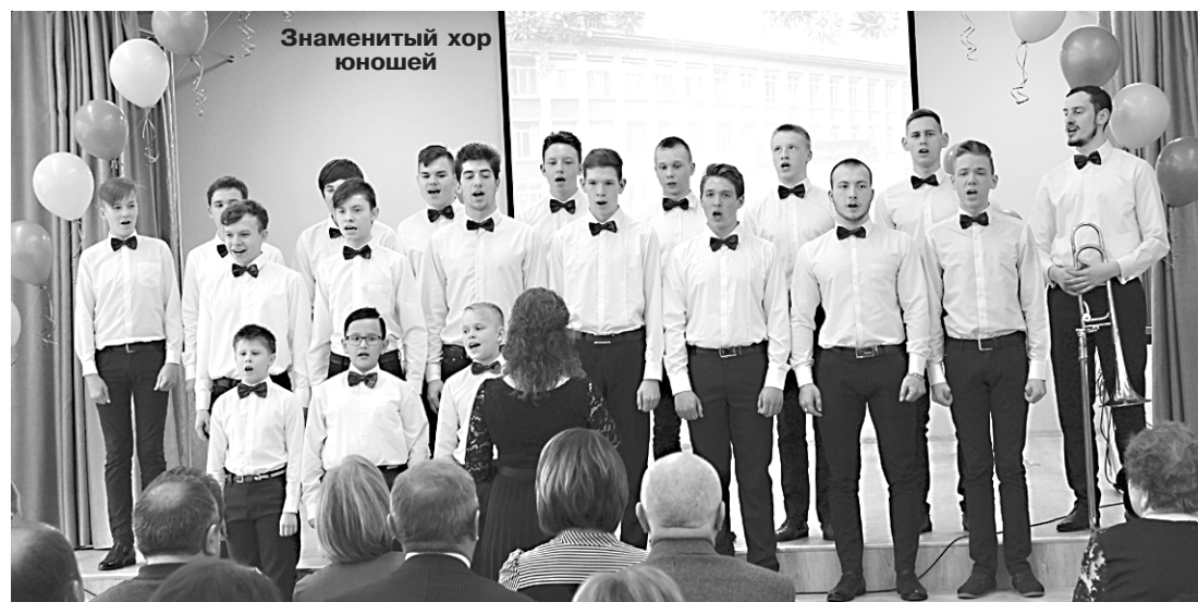
Знаменитый хор юношей