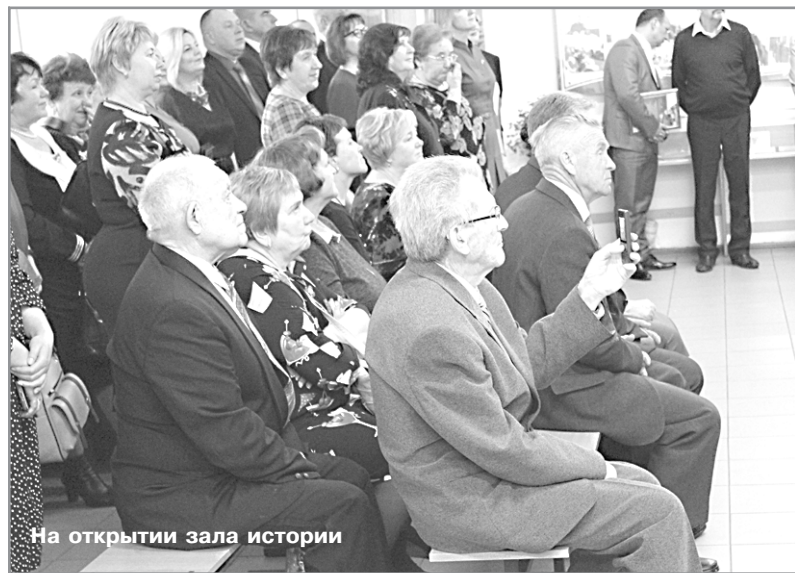
На открытии зала истории