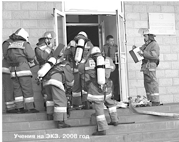
Учения на ЭКЗ. 2008 год

«Яиц много - всем хватит», - этой фразой успокаивали всех пришедших в заводоуправление на мастер-класс его организаторы. Понятно, что в предпраздничные дни тема украшения яиц становится очень популярной, а если совместить традицию и декоративно-прикладное творчество, то можно получить огромное удовольствие!