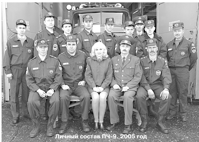
Личный состав ВПЧ-9. 2005 год